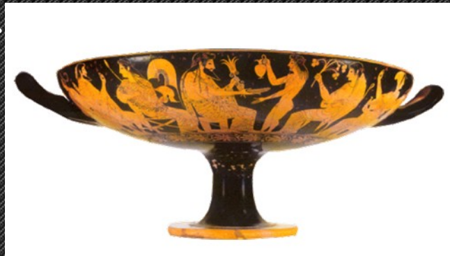
Κύλιος, πόσης για συμπόσια. Εξαγόταν ιδιαίτερα στους Ετρούσκους