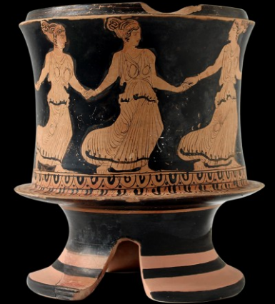
Τριποδική πυξίδα για φύλαξη καλλυντικών