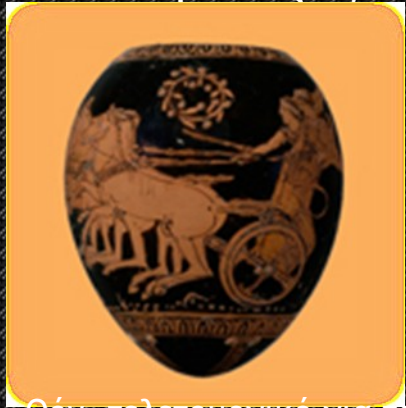
Κύλιος, τελετουργικό για τα κτερίσματα

Υπάρχουν δεκάδες είδη αγγείων τα οποία χωρίζονται σε 11 κατηγορίες: αποθηκευτικά, μείξης, ψύξης, άντλησης, μεταφοράς, πόσης, τελετουργικά, ελαιοδοχεία, φύλαξης, επιτραπέζια, οικιακά.