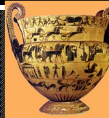
Ελικωτός/ελικοειδής κρατήρας. Χρήση: μείξη νερού με οίνο